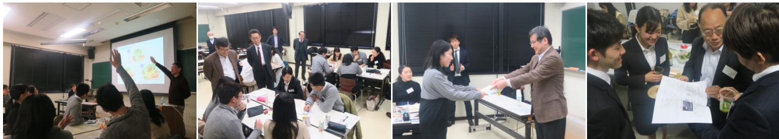
2018年度WSの様子：カゴメ株式会社、株式会社明治