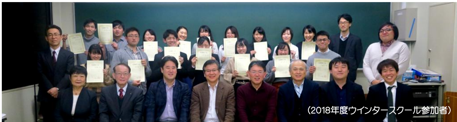
(2018年度ウインタースクール参加者)